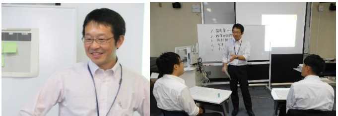
中学校・高等学校 情報・工業