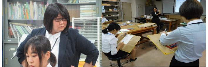
中学校・高等学校 美術・家庭