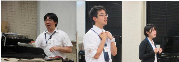
中学校・高等学校 音楽