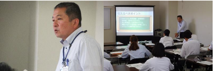
中学校・高等学校 保健体育