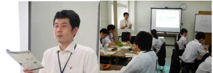
中学校・高等学校 外国語