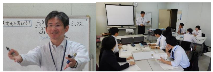
中学校・高等学校 理科